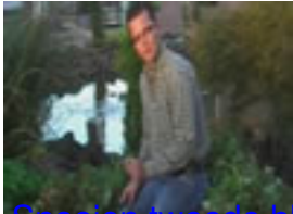
Snoeien tweede bloei