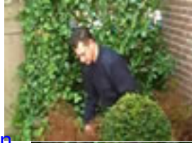
Vaste planten afknippen