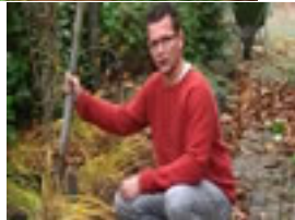
Vaste planten scheuren