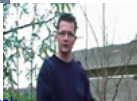
Houtstek of winterstek