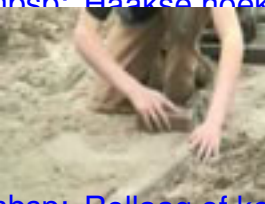
&nbsp;Rollaag of koprollaag